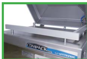
WVC-P400LH ハイカウンターバー